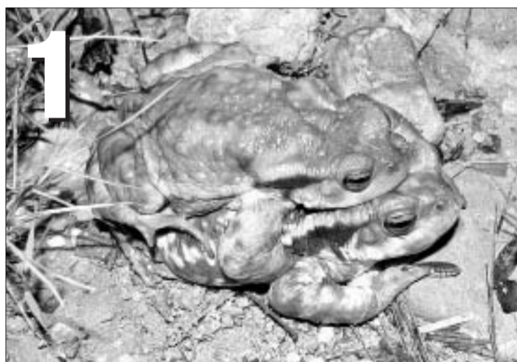
R. SALES GARCÍA

Su cuerpo tiene aspecto robusto. Se desplaza dando pequeños saltos aunque también lo hace gateando como el sapo corredor ( Bufo calamita ). El sapo común, presenta sobre su