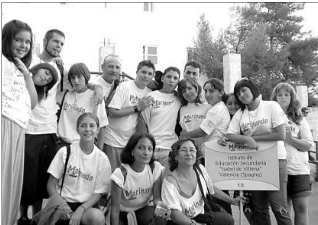
IES ISABEL DE VILLENA

Desde la asignatura optativa de Dramatización y Teatro de 1º de