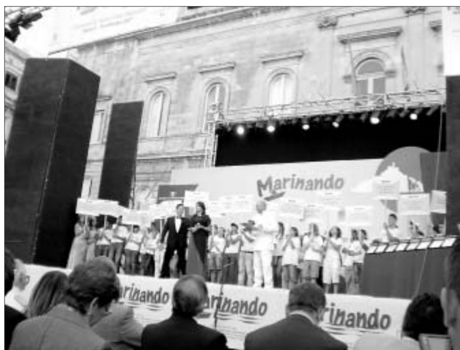
IES ISABEL DE VILLENA